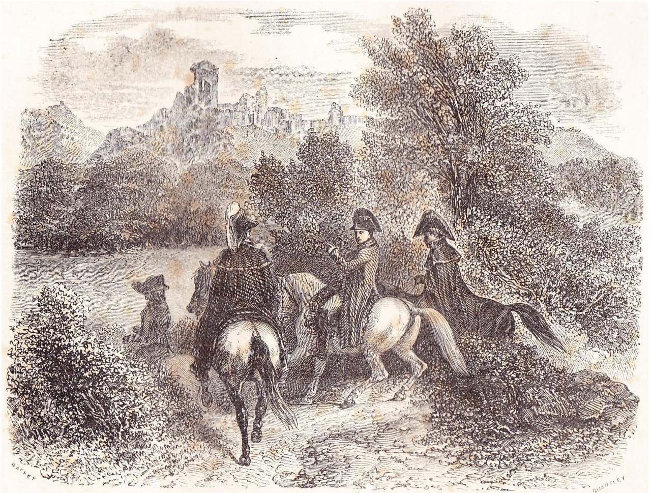
Napoléon visite les ruines de Dierstein

“Napoléon visite les ruines de Dierstein” , illustration horizontale , hors texte entre les pages 374 et 375 de NORVINS , Histoire de Napoléon (éd. belges de 1839 et 1841).